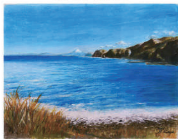
「西伊豆の海」(松崎町・石部にて) 甲賀 新