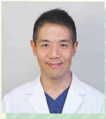
コミュニティーホスピタル 甲賀病院 院長